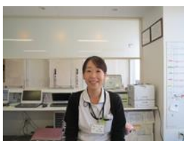
自分のしたいケア・看護ができ最高です。