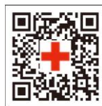
高松赤十字病院 QRコード

当院はNPO 法人イーজেイネットより「ホスピタリティ(働きやすい病院評価事業)」の認証を香川県で初めて取得しました。当院の働きやすい環境作りへの取り組みが認められた証です。