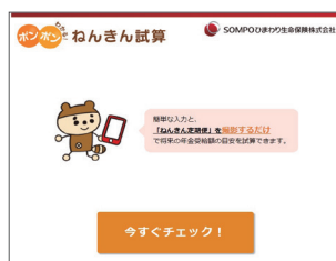
ねんきん試算 ホーム

「ねんきん定期便」をスマートフォンまたは タブレットのカメラで撮影し、必要項目を 入力するだけで、公的年金受給額の目安が 簡単に試算できます！