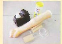
採血・静注シミュレータ