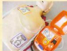
AEDトレーニングユニット

コロナ関連施設等へ就業する看護職のためのスキルアップ研修、新型コロナウイルス感染症に関する看護職の離職防止相談窓口を新しく開始します！ 詳細については、香川県看護協会ホームページに掲載予定です。