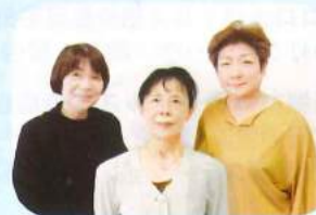
就業支援コーディネーター

再就職支援だけでなく、就職後もサポートします！ 再就職した後も、不安なこと、悩み事などございましたら、お気軽にお電話ください。