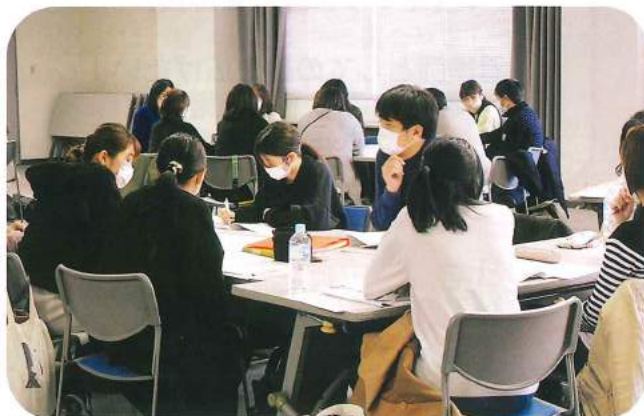
演習（災害・感染）風景