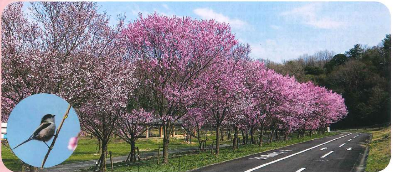
(上) 湊川の河津桜 (東かがわ市 白鳥)